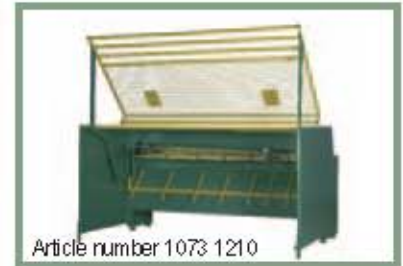
Article number 1073 1210