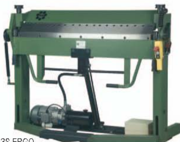
HS 3S ERGO