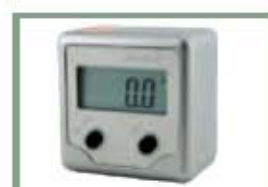
Article number 1043 6150

DK Vinkelmåler - se side 39 for mere info